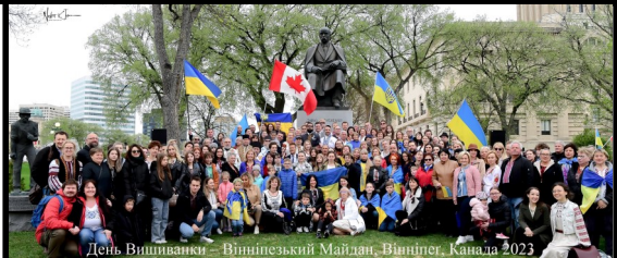
День Вишиванки – Вішнівецький Майдан, Вінніпег, Канада 2023

The 23rd Annual Walk for Mary will be held on Sunday, May 28th, 2023 at Holy Eucharist parish, Watt & Munroe. Join us in “Walking and Praying together on the Feast of Pentecost.” Registration starts at 1:30 pm followed by the walk starting at 2:00 pm. Pledge forms are available at: archeparchy.ca (under the events) and at all Parishes and Catholic Schools. For more information call (204) 669-3666 or 204-294-2276 or email zenova@mymts.net