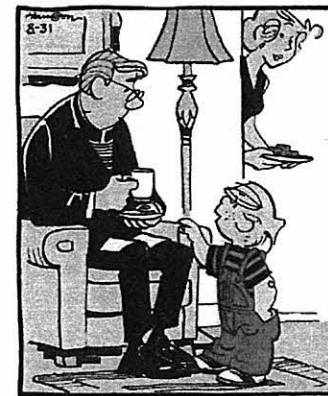
"So, Father, what?... you work Sundays and the other six days, you just hang out?"